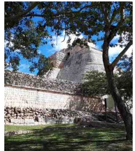
Uxmal, grote piramide

We bezochten ook de Maya-ruïnes. We hebben drie van deze vervallen steden gezien; Mayapán, Uxmal en Oxkintok. Bij Uxmal hebben we een paar nachten gelogeerd zodat er alle tijd was deze te kunnen bekijken. Vroeg in de ochtend ernaartoe, met een gids. Bijzondere man, trots als hij is dat hij van de Maya's afstamt. Hij legde ons veel uit over de manier van leven van de Maya's, hun bouwwerken, de stenen motieven erop en veel meer.