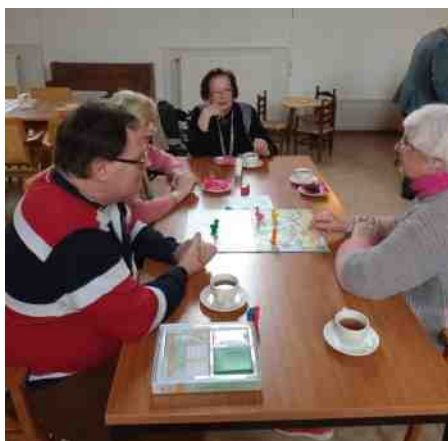
Voorpagina en pagina 2: spellenmiddag op 16 maart.

Wilt u informatie op de website laten plaatsen, neem dan contact op met het Kerkelijk Bureau, duinvre@xs4all.nl .