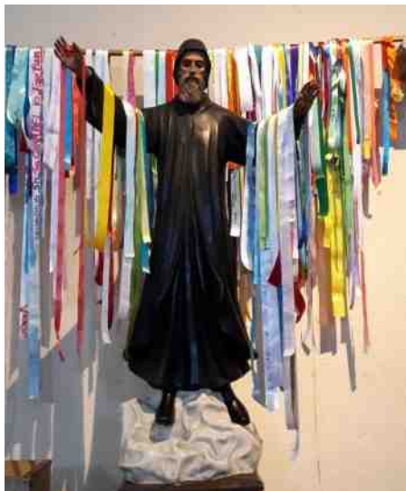
St. Charbel Makhlof. Op de linten staan gebeden.

Mérida, de hoofdstad van Yucatán, is een grote stad (meer dan 700.000 inwoners) maar komt niet zo over. Dat is omdat er eigenlijk alleen maar laagbouw is. De huizen zijn in de mooiste kleuren geschilderd, je ziet een turquoise gevel naast een oranje en verderop nog een paarse. Witgepleisterde balken onder de dakrand maken het bijna tot een schilderij. De oudste kathedraal van Amerika staat in deze plaats. Gebouwd tussen 1561 en 1598 en gewijd aan San Ildefonso. We zagen daar een bijzonder mooi beeld