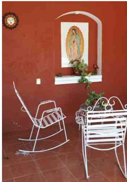
De Virgen van Guadalupe

staan, St. Charbel Makhlof, volledig behangen met allerlei linten. Makhlof is een 'nieuwe' heilige, hij is in 1977 heilig verklaard. Op de linten staan gebeden geschreven.