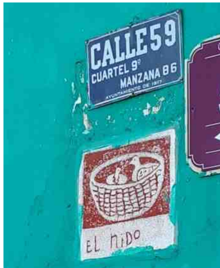
El Nido, het nest

Naast het bekijken van de stad, waar we zelfs naar een klassiek concert gingen met een Amerikaanse solo