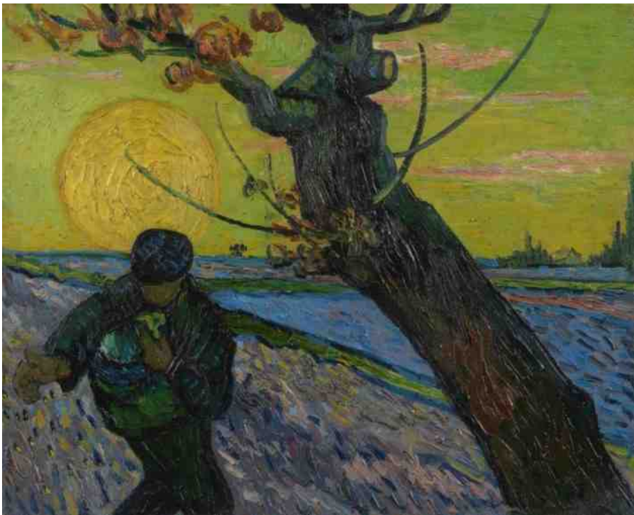
Vincent van Gogh, De zaaier, 1888, Van Gogh Museum, Amsterdam