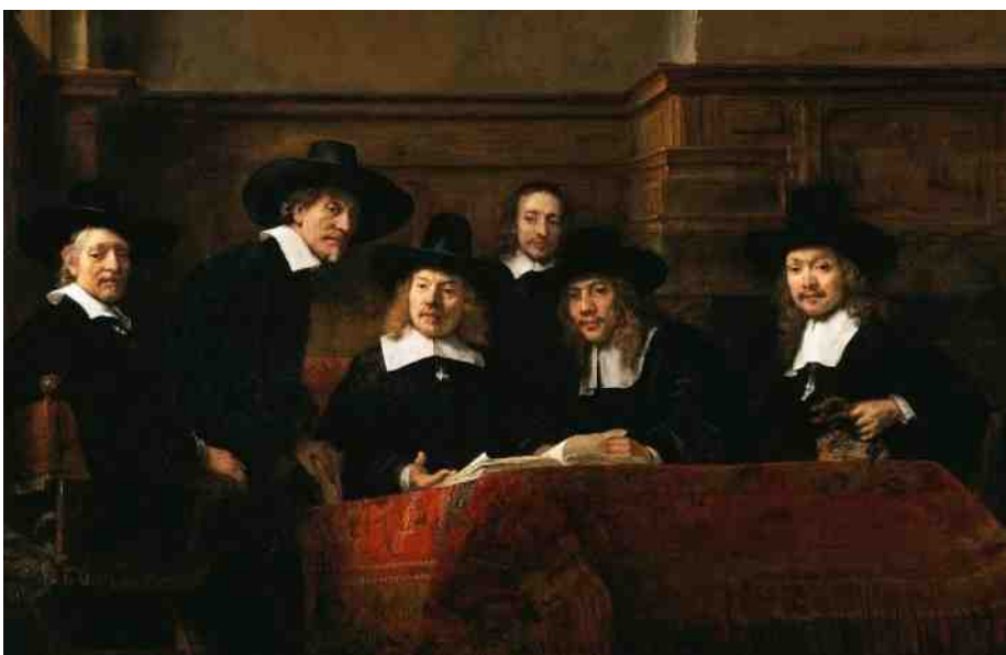
De kerkrentmeesters in beraad (De Staalmeesters, Rembrandt van Rijn, 1662)